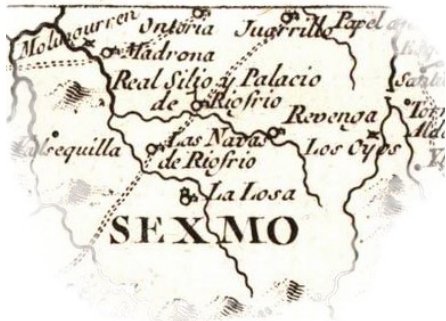
Mapa de Segovia de Tomás López, 1773

En 1247 aparece mencionado el pueblo de Río Frío en archivos de la Catedral de Segovia. La existencia de este poblado se confirma en su iglesia de la Inmaculada Concepción de María , que posee características del románico del siglo XIII, sobretodo representado en su magnífica portada con figuras de inquietantes animales.