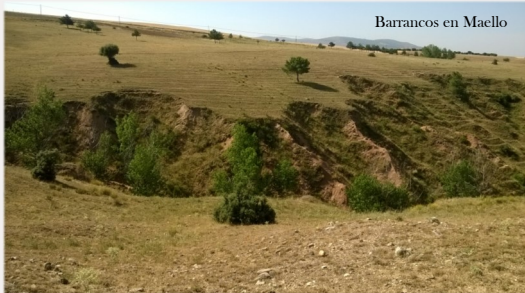
Barrancos en Maello

Llegando a Aldeavieja contemplamos la roca granítica, tanto en las construcciones cómo en bolos redondeados en los alrededores y hacia la ermita de Nuestra Señora del Cubillo. La roca que se explota en la cantera de Aldeavieja es la corneana, una roca muy dura usada como balasto en las líneas del AVE. Su dureza se refleja en el paisaje mediante cerros redondeados alineados que desde el Cubillo a Aldeavieja son: cerro de Avena, del Asperón, Cantogordo, del Campo y del Calvario.