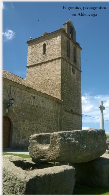
El granito, protagonista en Aldeavieja