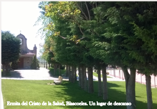
Ermita del Cristo de la Salud, Blascoles. Un lugar de descanso

El Mioceno es un periodo geológico que ocupa desde hace 23,5 hasta hace 5,3 millones de años, y coincide con el momento de mayor actividad en la formación de sierras cómo la de Ojos Albos. La elevación de esta sierra hizo que el agua arrastrara arenas y arcillas rojizas hasta zonas más bajas. Estos materiales son muy fáciles de remover y donde los cruzan arroyos y ríos forma cicatrices en el terreno que ofrecen un bello paisaje de barrancos rojos que contemplaremos en Maello (arroyo Milanos) y al cruzar el río Cardeña.